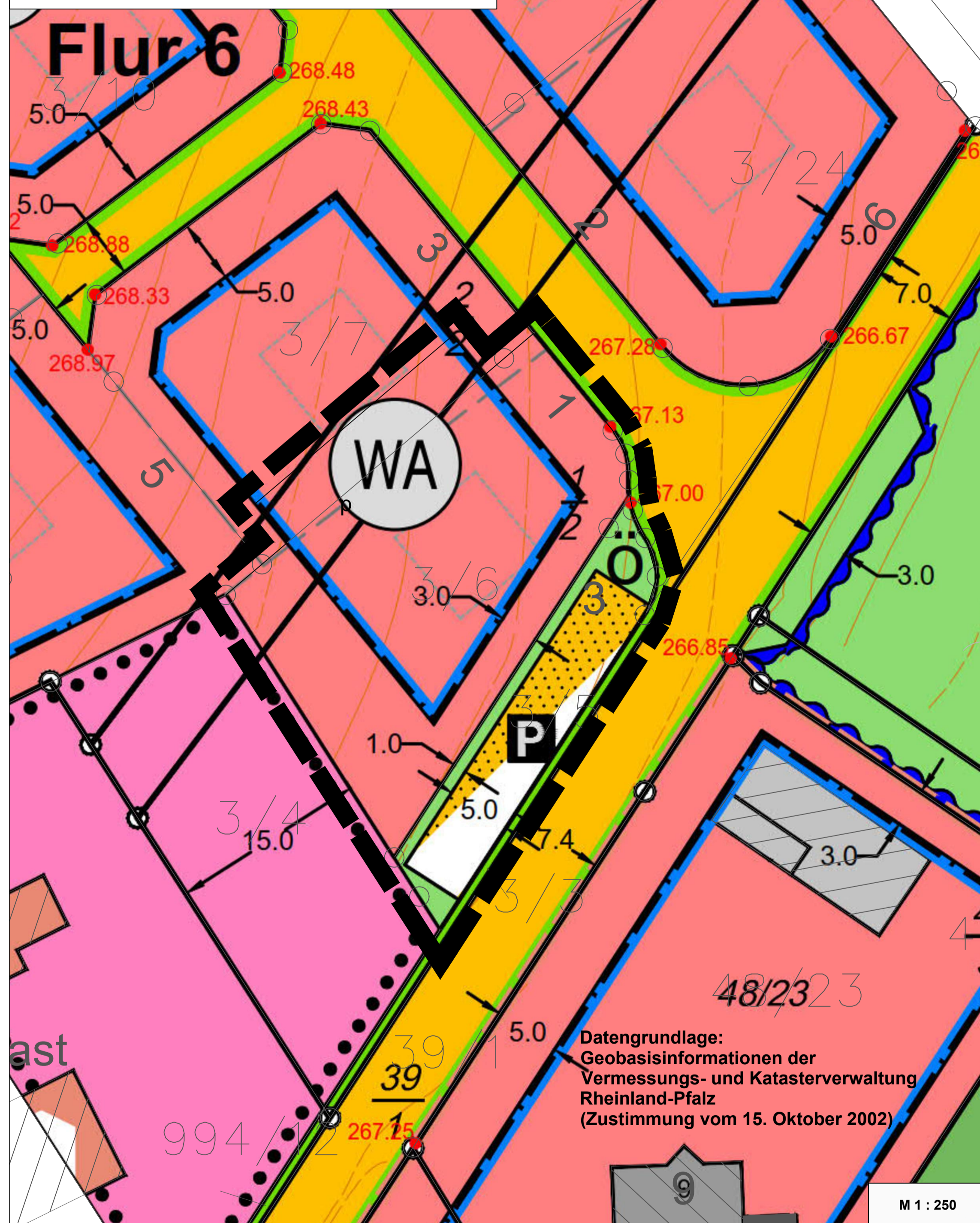
Ausschnitt aus dem Stammpflan