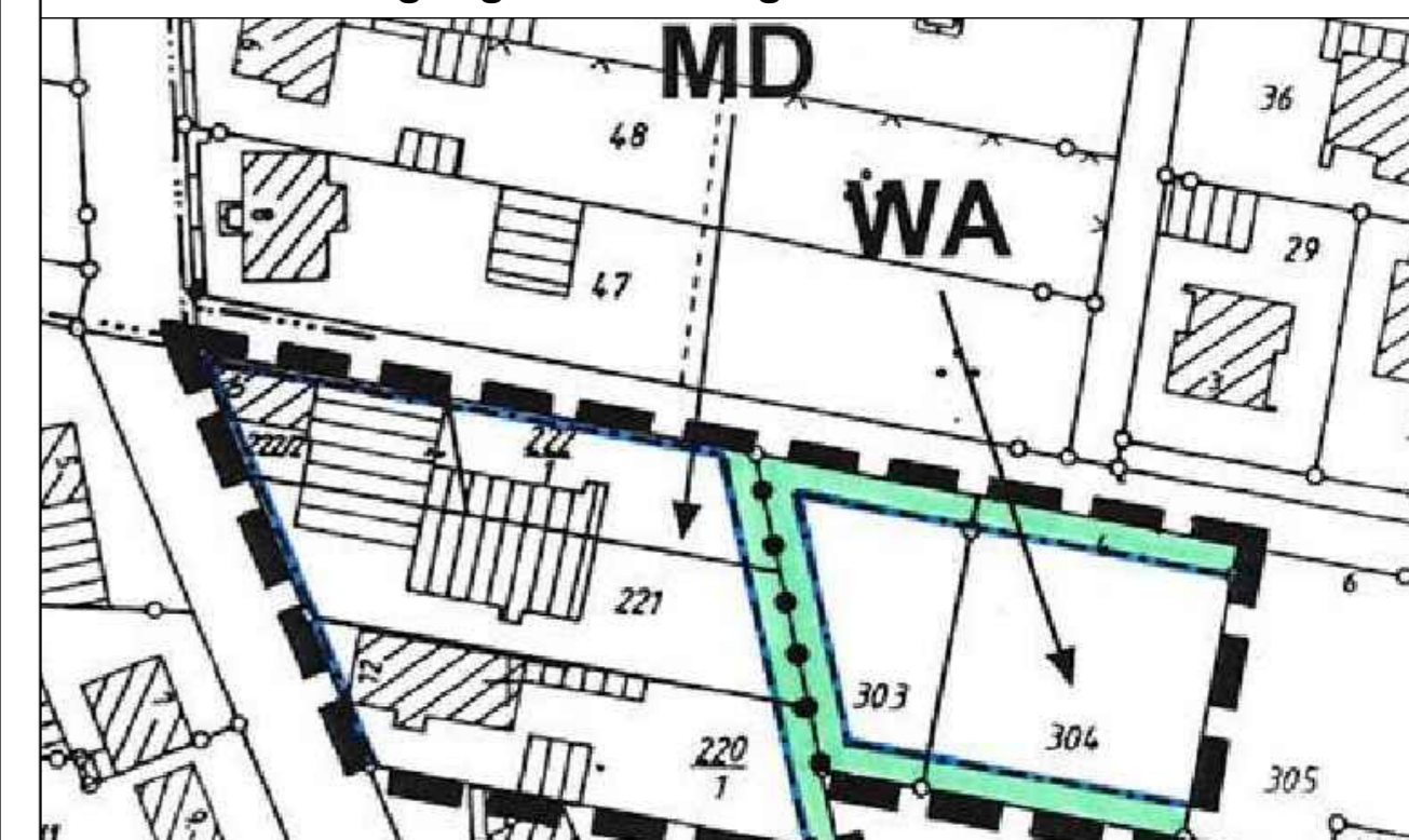
Auszug aus 2. Änderung

Für den Geltungsbereich der vorliegenden 3. Änderung wird eine Dachneigung bis 38° festgesetzt.