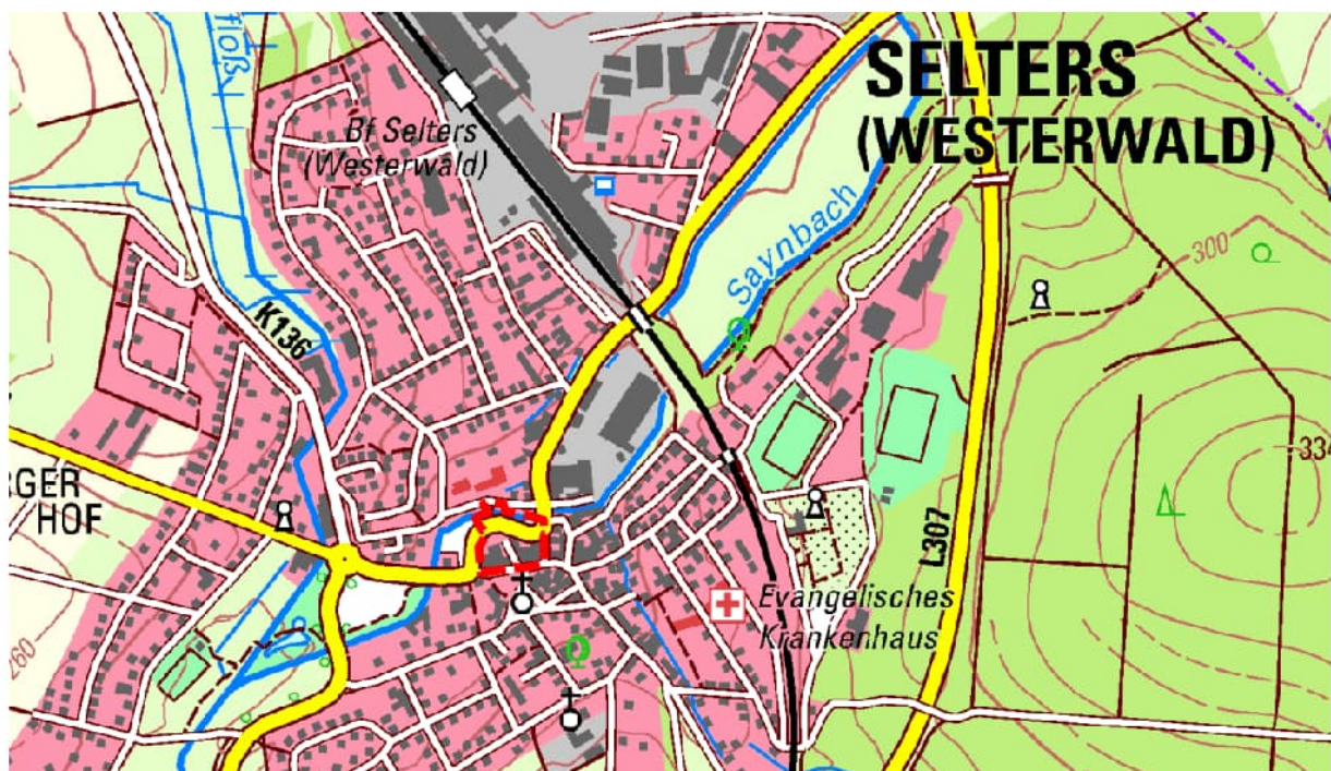
Lage des Plangebiets in der Stadt, Ausschnitt aus der TK25, unmaßstäblich

Im Süden grenzt das Gebiet entlang der Rheinstraße an den städtisch geprägten gemischt genutzten Bereich um den Marktplatz mit der Ev. Kirche Selters. Die östliche Grenze ist durch den historischen Gebäudebestand der Bahnhofstraße geprägt. Den westlichen Abschluss bildet der geschwungene Verlauf der Bahnhofstraße, jenseits der Straße liegen großflächige Stellplatzanlagen. Im Norden wird das Plangebiet, mit Ausnahme einer Teilfläche, die über den Bach hinaus in die nördliche Uferzone hineinragt, durch den Saynbach begrenzt. Nördlich davon liegt das Gebäude der Verbandsgemeindeverwaltung sowie nordöstlich der Gebäudekomplex des Saynbach-Centers.