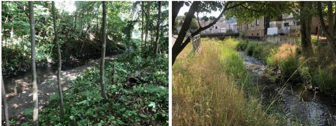
Abb.: Blick auf den Saynbach im Bereich des bestehenden Parkplatzes (links) und hinter der bestehenden Bebauung der Bahnhofstraße (rechts)

Der Gewässerverlauf im Bestand ist z.Z. stark durch Bewuchs geprägt und wurde zur Ermittlung des hydraulischen Abflussvermögens tachymetrisch aufgenommen.