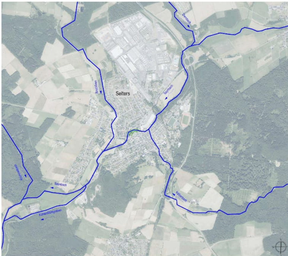
Abb.: Übersicht Saynbach in der Ortslage der Stadt Selters, mit den weiteren Zuflüssen Bruchfloß, Kälberbach, Mühlgraben

Der Saynbach als Gewässer III. Ordnung mit einer Gesamtlänge von 43 km durchquert die Stadt Selters aus nordöstlicher in südwestlicher Richtung. Das Einzugsgebiet insgesamt beträgt ca. 36,85 km 2 .